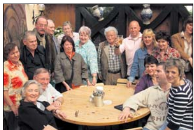
EINEN AUSFLUG nach Frankfurt unternahmen über 20 Gäste des Bessunger Weinhauses Gies. Nach einer Erlebnisfahrt auf dem Frankfurter Flughafen wurde noch der Bauernmarkt auf der Konstabler Wache besucht. Den Abschluss machte die Gruppe in der „Buchsheer“, einer typischen Frankfurter Apfelweingaststätte.

Seniorentreff Steubenplatz freitags von 14-17h, Steuben- platz 9, ☎ 06151/316844