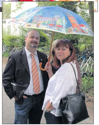
Gabi und Walter Hoffmann gaben sich gelassen und freundlich wie immer. Abgeschirmt im „Darmstadt-Look“ kam das Oberbürgermeisterheepar trockenem Hauptes auf dem Hausberg an.

Fest gebucht am Vaddertag kamen die KVBl'ler von den BBL-Freunden, die sonst am 1. Mai ihr traditionelles Turmfest feiern, den Vorzug. Und somit trafen sich die Maiwanderer mit den Bollerwagen-ziehenden Vätern tausend Fuß über dem Meer, um in trauter Runde zusammen zu feiern. Auch die wenigen Regenschauer an diesem Tag konnten dem gestandenen Frischluft-Fanatiker nicht die gute Laune nehmen, wie nebenstehendes Bild zeigt. Gabi und Walter Hoffmann gaben sich gelassen und freundlich wie immer. Abgeschirmt im „Darmstadt-Look“ kam das Oberbürgermeisterheepar trockenem Hauptes auf dem Hausberg an.