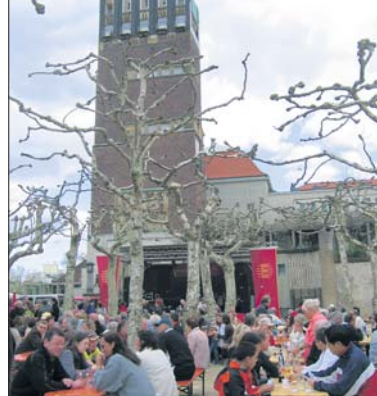
GUT BESETZT waren die Bänke beim Jazzpiknik am 1. Mai. Hunderte Besucher kamen am Vatertag – trotz des wechselhaften Wetters – auf die Mathildenhöhe, um der Musik zu lauschen und bei einem Plausch Gegrilltes und Gekühletes zu genießen.

Odenwaldklub Nd.-Ramstadt 13.5., 14h Schloßgartenpl. „Se- niorenwanderung“