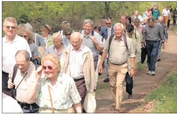
VOM PRINZENBERG ZUR ROSENHÖHE führte die Premierenwanderung auf dem „Sieben-Hügel-Steig“ am 27. April. (Zum Bericht)

genieur Peter Fischer mit einer kurzen Geschichte über den Waldpark Marienhöhe. Auch beim Turmfest der BBL auf der Ludwigshöhe kamen die Teil-