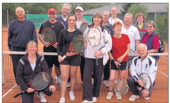
GUTES TIMING bewiesen die „Tennis-Cracks“ anlässlich der Eröffnung der Sommersaison am 1. Mai auf der Tennisanlage Haldy & Böhmman in Roßdorf. Bei strahlendem Sonnenschein startete das Mixed-Turnier – und kaum war das letzte Match vorbei, ging ein Regenschauer nieder, was der guten Stimmung aber nicht schadete. Auch abseits des Platzes vergnügten sich zahlreiche Gäste auf der Anlage, wofür auch Köstlichkeiten vom Grill und das berühmte Salatbuffet sorgten. Die Einnahmen und Spenden des Tages kommen wie in jedem Jahr dem Behindertenzentrum Roßdorf zugute.