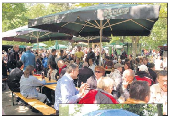
DIE BESSUNGER KARNEVALISTEN meldeten ebenfalls „Full House“ am „Doppelfeiertag“ auf dem Bessunger Hausberg.

MÜHLTAL (GdeM). Am 18.5. findet im Mühlhaller Ortsteil Traisa der Grenzgang statt. Treffpunkt ist um 11.30 Uhr am Speckbrünchen. Die Schluffrast findet an der Otto-Krämer-Hütte statt. Analog anderer Grenzgänge wird ein Unkostenbeitrag in Höhe von 3 Euro erhoben.