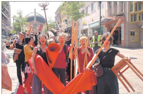
CATWALK FÜR DIE KUNST. Vergangenen Samstag (3.) feierte das Theater Moller Haus seinen 10. Geburtstag. Auf einem 500 Meter langen roten Teppich vom Theater bis zum Luisenplatz boten die Schauspieler ein buntes Geburtstags-Programm.

Erste-Hilfe Kurse 17./18.5. und 26./27.5., jew. 8-16h Erste-Hilfe Training 28.5., 8-16h